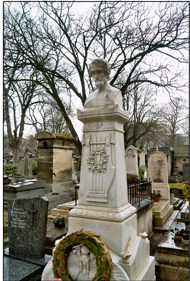
Das Grab Heinrich Heines in Paris

Ein Kind mit großem Kürbiskopf Hellblondem Schnurrbart, greisem Zopf, Mit spinnig langen, doch starken Ärmchen, Mit Riesenmagen, doch kurzen Gedärmchen, - Ein Wechselbalg, den ein Korporal, Anstatt des Säuglings, den er stahl, Heimlich gelegt in unsre Wiege, - Die Mißgeburt, die mit der Lüge, Mit seinem geliebten Windspiel vielleicht, Der alte Sodomiter gezeugt, - Nicht brauch ich des Ungetüm zu nennen - Ihr sollt es ersäufen oder verbrennen!